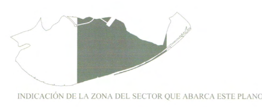
INDICACION DE LA ZONA DEL SECTOR QUE ABARCA ESTE PLANO